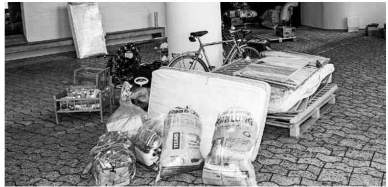
Hilfsgüter für das tägliche Leben.