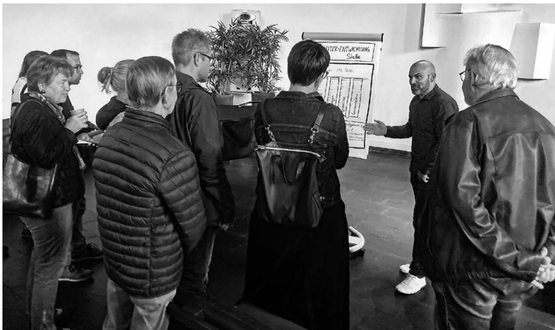
Kirchbürgerinnen und Kirchbürger informieren sich über die Anpassung der Organisationsstruktur.

Wir bitten für die Kirchgemeindeversammlung, dass sie in einem guten und konstruktiven Miteinander stattfindet. Wir bitten, dass die Strukturveränderungen dazu beitragen, dass Neues entstehen darf. Wir bitten, dass die schlankeren Strukturen dazu beitragen, dass die guten Ideen aus der Gemeinde schneller umgesetzt werden können.