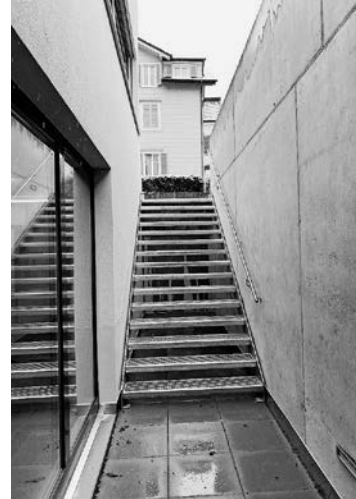
Neuer Treppenaufgang beim Jugendraum.