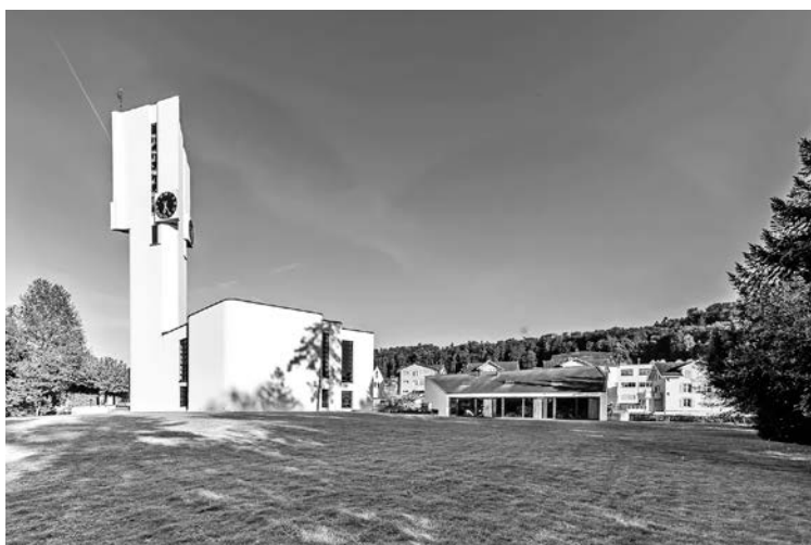
Johanneskirche Bischofszell mit Kirchenzentrum.