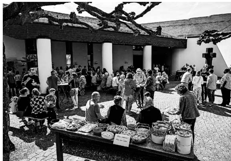
Sommerfest-Stimmung mit Teilete und Tiefgang – am Lord's Meeting vom Sonntagabend, 5. Juli.

Wie genau an den Stationen fröhlich-tiefgründig in die Sommerpause gestartet wird, heckt das Team in diesen Wochen noch aus und nimmt sogar allfällige Ideen von Gemeindegliedern gerne entgegen. Alle Stationen sollen zum Ausdruck bringen, wie