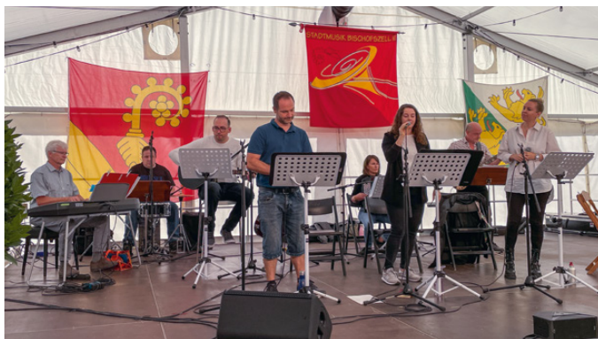
ökum. Gottesdienst Stadtfest