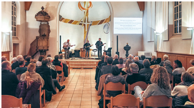
Sound & Soul