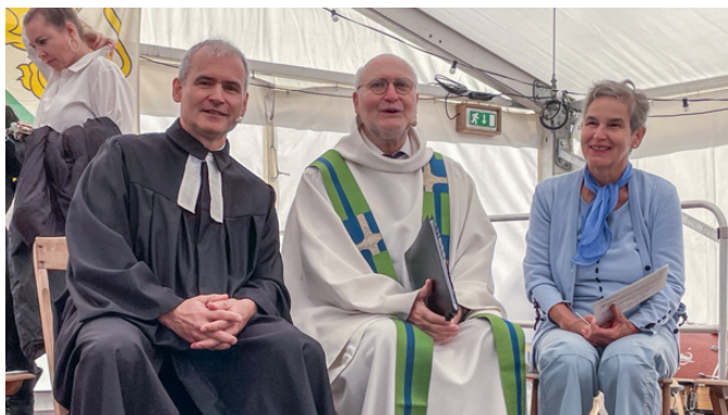
ökum. Gottesdienst Stadtfest