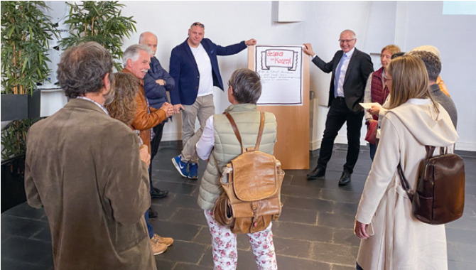
Informations- und Diskussionsanlass